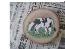
森のキーホルダー