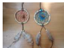
ドリームキャッチャー 2時間~/30名