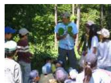
子ども樹木博士 2.5時間~/15名