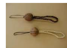
クルミのストラップ 2時間~/30名