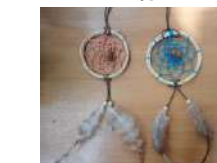
ドリームキャッチャー

お一人様より対応(りんごジャムとおやきは5名様以上) 所用時間:1.5時間~ 料金 2,700円/人 会場:やまぼうし自然学校事務所