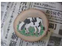
森のキーホルダー 1.5時間~/30名