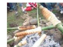
マイギリ式火おこし & 青竹パンづくり 2.5時間~/30名