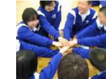
チャレンジワークショップ 2時間~/20名