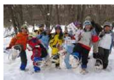
☺ 雪の森ネイチャートレイル 2.5時間~/15名