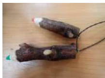
小枝のストラップ 1.5時間~/30名