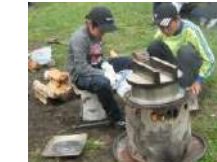
デイキャンプ 4.5時間~/30名