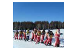
☺ スノーシューハイキング 2.5時間~/15名