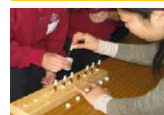
アロマハンドクリームづくり 1.5時間~/30名

かご編みは 2017 年で終了しました。2020 年度より実施できる代替のプログラムを準備中です。