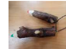
小枝のストラップ