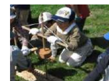
マイギリ式火おこし & 糞ピザづくり 2.5時間~/30名