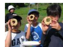
青竹クーヘンづくり 2.5時間~/30名