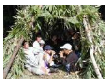
ティピー作り & 森のティータイム 3時間~/20名