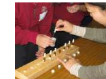
アロマハンドクリームづくり