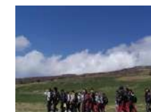
ハイキング 2.5時間~/20名