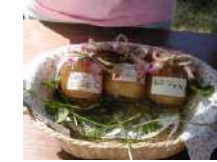
りんごジャムづくり (5名以上)

りんごジャムとおやきは食材がある時のみ対応いたします。事前確認が必要です。また当日のキャンセルもできません。