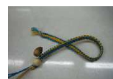
ヘンプミサンガ (中・高校生向け) 1.5時間~/30名