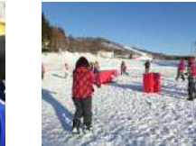
☺ 雪合戦 2時間~/15名