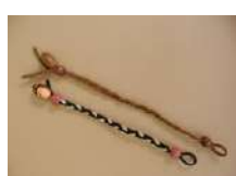
三つ編みミサンガ (小学生向け) 1時間~/30名