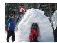
☺ イグルー作り 4時間~/15名