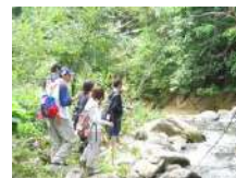
溪流釣り (解禁期間のみ) 2.5時間~/8名