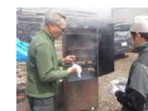
燻製づくり 2.5時間~/30名