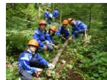
森づくり体験 2.5時間~/15名