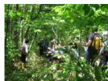
ネイチャートレイル 2.5時間~/15名