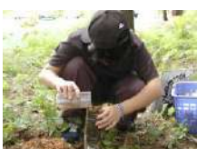
森の土壌調査 2.5時間~/15名