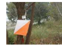
オリエンテーリング 2時間~/30名