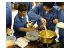
りんごジャムづくり 2.5時間~/30名 (室内のみ)