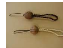
クルミのストラップ