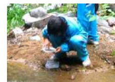
水棲生物調査 2.5時間~/15名