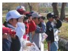
バードウォッチング 2.5時間~/15名