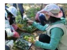
森の恵みウォーキング (山菜とり)※春期のみ 2.5時間~/30名