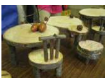
ウッドクラフト 2.5時間~/30名

かご編みは 2017 年で終了しました。2020 年度より実施できる代替のプログラムを準備中です。