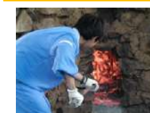
炭焼き体験 3時間~/40名