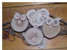
ウッドパッチワーク 1時間~/30名