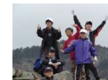
登山 実施場所ごと/30名