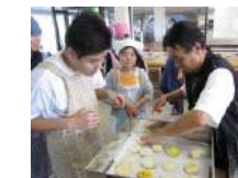
おやきづくり 2.5時間~/30名 (室内のみ)