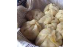
おやきづくり (5名以上)